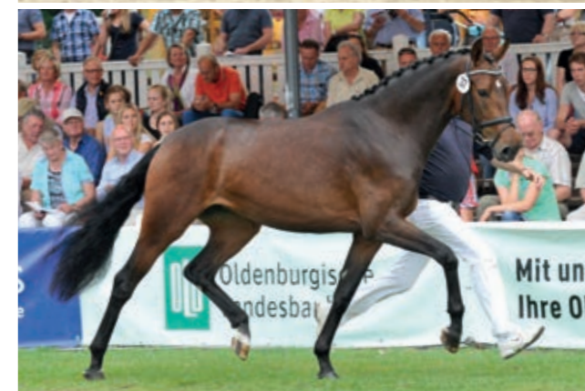
Landeschampionesse und Id-Brillantringstute Auguste Victoria (oben) v. Sandro Hit und ihre Tochter Reservesiegerstute Amelie (unten) v. Fürstenball.