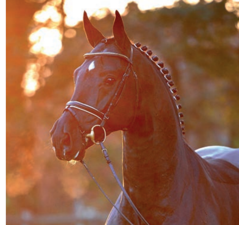
Stempelhengst San Amour I v. Sandro Hit.