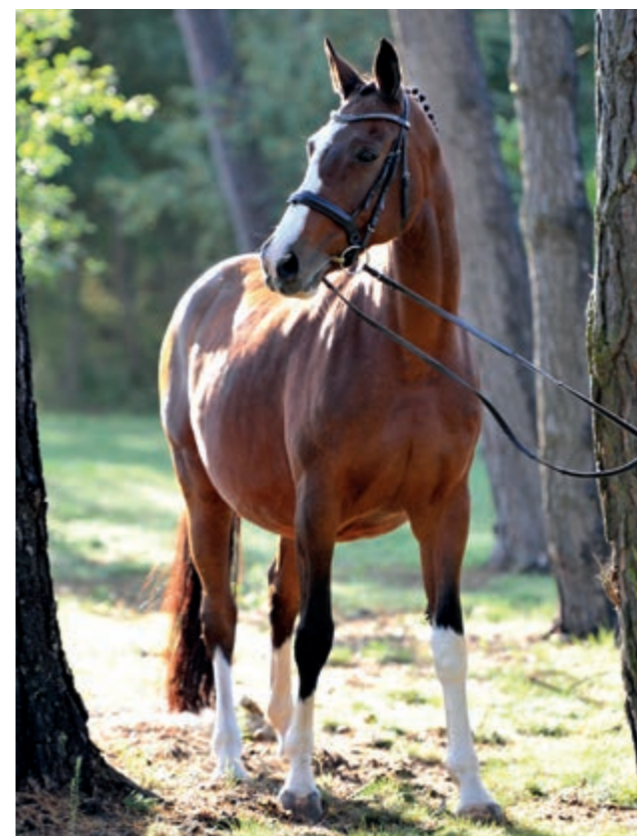
Stammgründerin Puppenfee v. Plaisir d'Amour